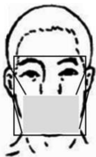
图 B.1 匿名化漏检数结果示例

示例: 图片中存在已佩戴口罩的人脸目标(如图 B.1 所示),人脸目标未进行匿名化处理,根据人脸目标边界框比对,可见范围大于 50%,可见范围内包括眉毛和眼睛,可清晰定位,该目标计入漏检数。